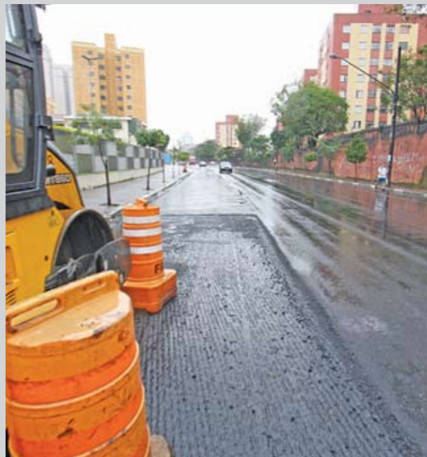
Av. Direitos Humanos: trecho está recebendo asfalto novo

S aiu mais um lote de vias que receberão asfalto novo na cidade. É a quinta etapa do programa de recapeamento da Prefeitura de São Paulo este ano. Desta vez, reúne 59 ruas na área de 22 Subprefeituras, somando 43,5 quilômetros de extensão. Na nossa região, um trecho de 2,6 quilômetros da avenida Direitos Humanos (entre a avenida Imirim e a rua General José de Almeida Botelho, no Mandaquí), já está sendo recapeado. No entorno da Marginal Tietê, a Dersa recapeou outras 110 vias (cerca de 100 quilômetros) em parceria com a Prefeitura, como forma de compensar o tráfego intenso que essas vias receberam durante as obras da Marginal.