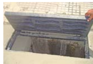
Nova grelha na av. Zaki Narchi com rua Urupiara

Santana é uma das 12 regiões da cidade que estão recebendo grelhas de plástico reciclado em substituição às de aço. Elas são feitas a partir de embalagens de detergente, amaciante de roupas e desodorante, por exemplo. O objetivo é evitar o roubo das grelhas de metal que ficam nas sarjetas, já que as de plástico não têm valor comercial e funcionam da mesma forma que as outras. Anualmente, a Prefeitura repõe cerca de 4 mil grelhas furtadas na cidade. Elas ajudam no escoamento da água da chuva, impedindo que objetos caiam em galerias e ramais e causem entupimento do sistema de drenagem, o que provoca enchentes.