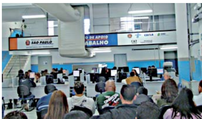
Espaço de atendimento do CAT: carteira de vagas disponíveis

Desde o mês passado, quem procura emprego tem um dia a mais na semana para fazer isso. As unidades do Centro de Apoio ao Trabalho (CAT) de Santana e do Tucuruvi começaram a funcionar também aos sábados. Lá, é feito contato entre os trabalhadores desempregados e as empresas com vagas abertas, habilitação do seguro-desemprego, emissão de Carteira de Trabalho e estímulo a atividades empreendedoras, entre outros serviços. O CAT Santana fica na rua Voluntários da Pátria, 1.553, e funciona de segunda a sexta, das 7h às 18h, e aos sábados, das 8h às 13h. O CAT Tucuruvi fica na avenida General Ataliba Leonel, 2.764, e abre de segunda a sexta, das 8h às 17h, e aos sábados, das 8h às 13h.