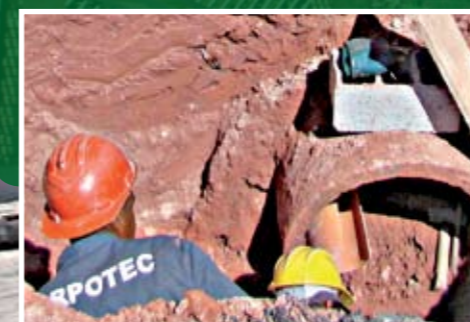
Acima, galeria em obras; ao lado, pronta

A Subprefeitura acaba de entregar a obra de ampliação da rede de águas pluviais na rua Salvador Tolezano, em frente à Paróquia Santo Antônio, no Mandaqui. Ali, moradores dos prédios conhecidos como Conjunto dos Bancários e toda a vizinhança foram beneficiados com a construção de mais 50 metros lineares de galerias e a instalação de uma tubulação mais larga. Com isso, deve acabar o constante empoçamento de água de chuva na parte baixa da rua, na altura do número 164. A água acumulada estragava o asfalto e era risco frequente de acidentes. Também foram reformadas duas bocas-de-lobo, construídas outras três e instalados três poços de visita na rua.