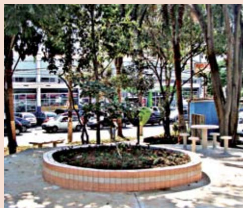
Largo Conselheiro Moreira de Barros: cara nova

QUER ADOTAR? Ligue para a Subprefeitura: 2987-3844, ramal 108 ou 110