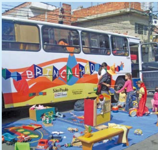
Evento em uma das 900 ruas de lazer existentes na cidade

Você sabia que a cidade de São Paulo tem 900 ruas de lazer? E que 37 delas ficam na nossa região? Essas ruas são fechadas aos domingos e feriados, das 8h às 17h, e podem ser usadas com segurança pela população para caminhar, andar de bicicleta, jogar bola, andar de skate, entre outras atividades recreativas. Se você quer que uma rua da nossa região vire rua de lazer, entre em contato com a Supervisão de Esportes e Lazer da Subprefeitura Pirituba/Jaraguá pelo telefone 3971-9066. Abaixo, veja onde ficam as 25 ruas de lazer existentes em Pirituba, as 5 do Jaraguá, as 5 de São Domingos e as 2 de Taipas.