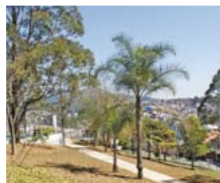
Praça Senhor do Vale

Atendendo a pedidos da comunidade, está sendo construído mais um parque no distrito do Jaraguá. Será o Parque Senhor do Vale, no lugar da praça Senhor do Vale, com 21 mil m 2 de área total. O projeto prevê cercamento de toda a área, calçadas de