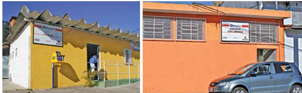
Unidade City Jaraguá: rua Giulio Eremita Telecentro Conj. City Jaraguá, na rua Paulo Arentino

Os moradores do Jaraguá acabam de ganhar três novas unidades do Telecentro. São eles o Telecentro City Jaraguá (rua Giulio Eremita, 450), o Telecentro Conjunto City Jaraguá (rua Paulo Arentino, 900) e o Telecentro Brasilândia B-3 Gov. Mário Covas (rua Vale do Sol, 59-B, Cohab Brasilândia), chamado assim pela proximidade com o distrito vizinho. Nos telecentros, as pessoas podem usar o computador para fazer trabalhos