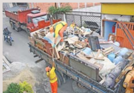
Acima, equipes fazem serviço de Tapa-Buraco nas ruas da região