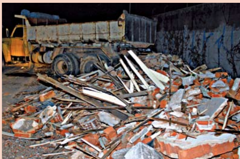
Flagrante de despejo de entulho: lugar tinha sido limpo um dia antes

A Subprefeitura Pirituba/Jaraguá está trabalhando pesado no combate ao despejo irregular de entulho nas ruas da nossa região. Esse é um problema que atinge várias áreas da cidade e está na mira da Prefeitura de São Paulo. No dia 18 de fevereiro, equipes da Subprefeitura, em conjunto com policiais civis e militares, flagraram um caminhão despejando cerca de cinco toneladas de entulho na rua José Peres Campelo, próximo à estação Piqueri da CPTM. O veículo foi apreendido, multado e os ocupantes foram encaminhados à delegacia de polícia. Um dia antes desta operação, a Subprefeitura tinha feito uma grande limpeza no local, retirando mais de 25 caminhões cheios de entulho que tinham sido jogados ali. Caso você veja alguém cometendo este tipo de crime, denuncie à Subprefeitura (tel.: 3903-7323).