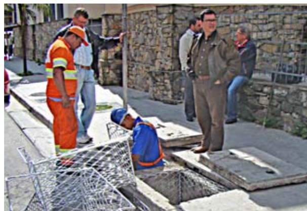
Instalação de cesto de boca-de-lobo no Largo de Pinheiros

Você tem gastos com a escola dos filhos, academia de ginástica, cabeleireiro, pet shop, estacionamento ou oficinas mecânicas, por exemplo? Então, pode pedir a Nota Fiscal Eletrônica nestes estabelecimentos e ganhar desconto no IPTU da sua casa ou do imóvel indicado por você. A Nota Fiscal Eletrônica é um programa da Secretaria Municipal de Finanças da Prefeitura de São Paulo, parecido com o da Nota Fiscal Paulista, do governo do Estado. Para fazer o cadastro e saber mais sobre este programa, basta acessar o site www.prefeitura.sp.gov.br/nfe . Lá, você encontra a lista de prestadores de serviço que emitem a Nota Fiscal Eletrônica, separados por tipo de atividade e por região da cidade. Participe!