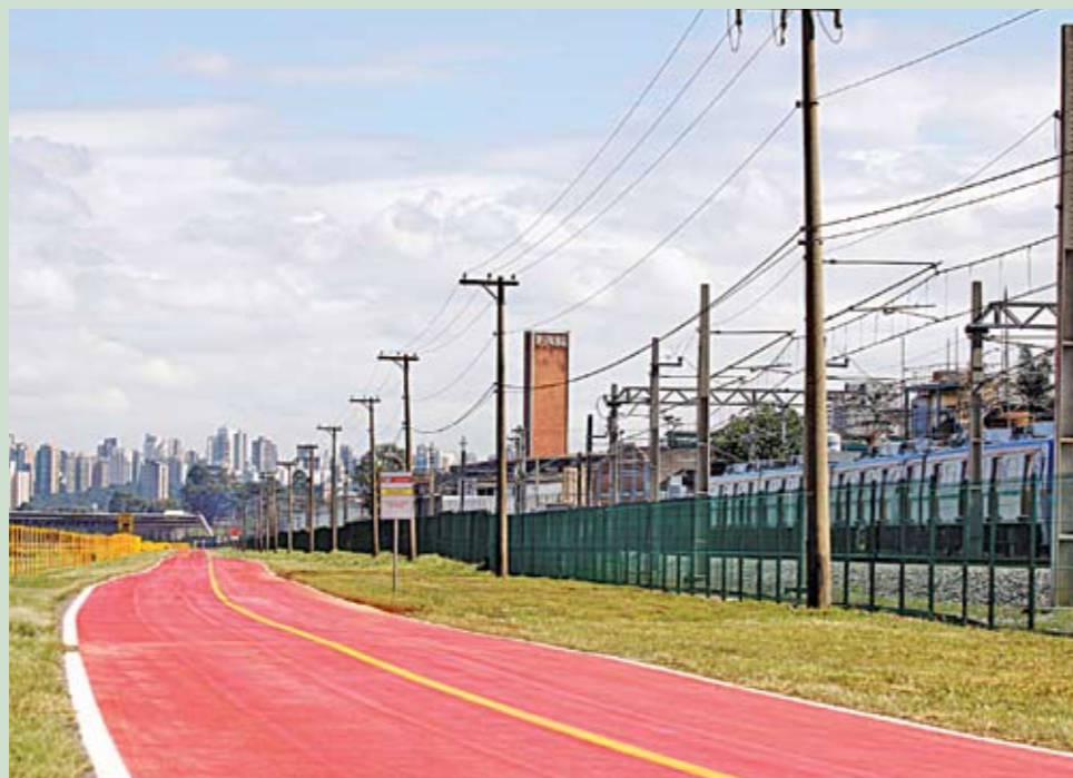
Ciclovía Rio Pinheiros: 14 quilômetros, da Vila Olímpia à estação Autódromo

Quando a ciclovía Rio Pinheiros foi aberta, no final de fevereiro, tinha apenas dois acessos. Um pela avenida Miguel Yunes e o outro pela passarela da Emae (Empresa Metropolitana de Águas e Energia), junto à estação Vila Olímpia. Agora, mais um acesso foi liberado. Ele fica na estação Jurubatuba e é, por enquanto, um acesso provisório. Até o final do ano, o local ganhará uma passarela superior que ligará a estação à ciclovía pela área externa. Mas isso é só o começo. Os próximos acessos a serem liberados são os da Estação Santo Amaro e o da TV Globo , entre a ponte Estaiada e a avenida Morumbi. Além disso, até o final deste ano outros seis quilômetros de ciclovía serão entregues, chegando até a estação Villa Lobos/Jaguará, com um total de 20 quilômetros de extensão.