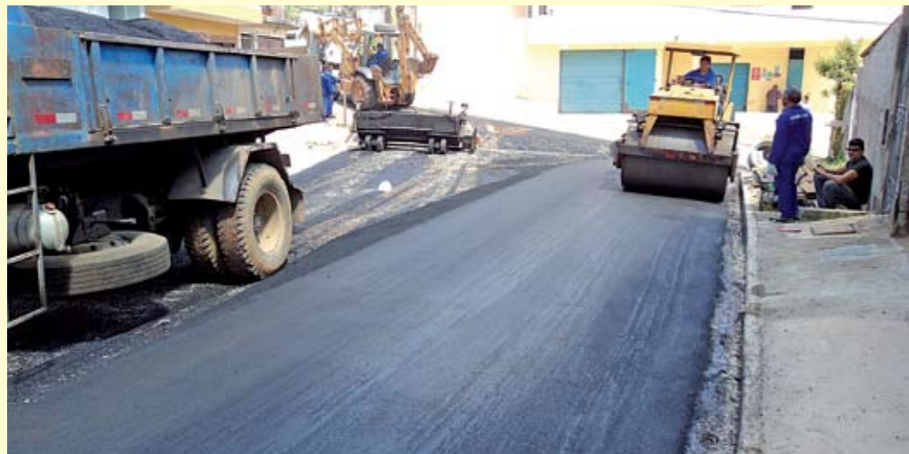
Rua Vinhedo: pavimentação, drenagem, guias e sarjetas

Várias ruas da nossa região tiveram a terra trocada por asfalto – e também ganharam sistemas de drenagem, galerias, guias, sarjetas e outras melhorias feitas pela Prefeitura para evitar enchentes. É o caso das ruas Índia e Grécia (Jardim da Conquista)