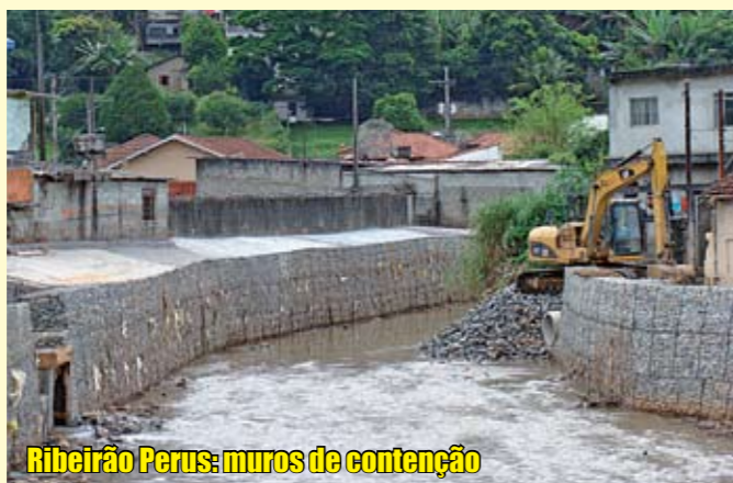
Ribeirão Perus: muros de contenção