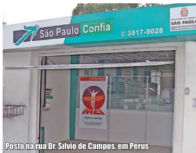
Posto na rua Dr. Sílvio de Campos, em Perus