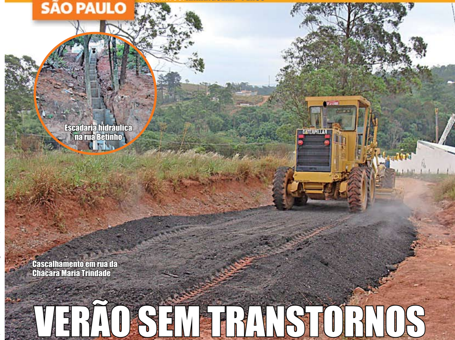
Escadaria hidráulica na rua Betinho