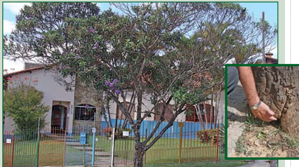
Árvores acompanhadas de perto por especialistas na nossa região

Desde agosto deste ano, as árvores da nossa região passaram a ser observadas mais de perto. A Secretaria de Coordenação das Subprefeituras ampliou o programa Identidade Verde, que agora está em 29 Subprefeituras da capital, incluindo Perus. Equipes de especialistas saem às ruas para fazer mapeamento e diagnóstico das árvores, verificando quais precisam de poda, de ampliação/reforma de canteiro ou até de remoção. Até agora na nossa região, foram cadastradas 79 árvores, com recomendação de 48 ampliações de canteiro e 56 podas, além de vários novos plantios. O objetivo é garantir a saúde das árvores e a segurança da população.