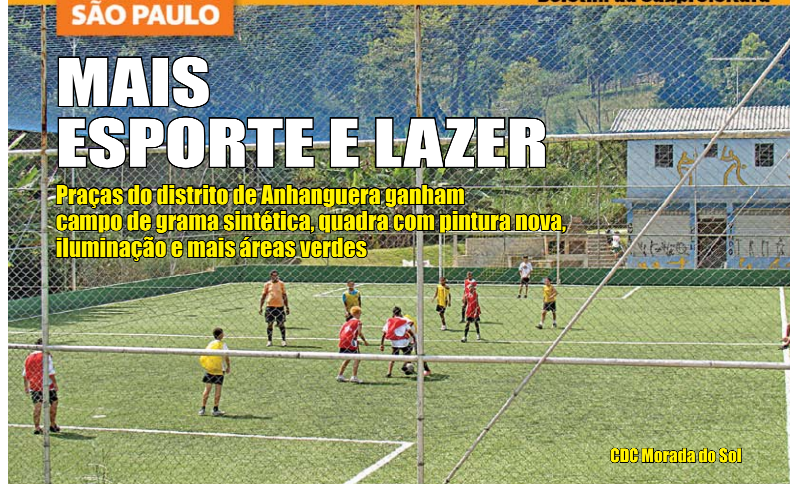
CDC Morada do Sol

Praças do distrito de Anhanguera ganham campo de grama sintética, quadra com pintura nova, iluminação e mais áreas verdes