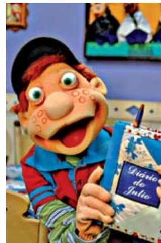
O garoto Júlio, do Cocoricó: personagens nas cartilhas e vídeos

A partir deste mês, vai ficar mais divertido aprender Português e Matemática para os alunos do 1º ao 3º ano do Ensino Fundamental da rede municipal. Eles vão ganhar novos amigos na sala de aula: o menino Júlio e a turma do Cocoricó. Um convênio entre a Secretaria Municipal de Educação e a Fundação Padre Anchieta coloca os personagens do seriado infantil da TV Cultura nas cartilhas e vídeos utilizados pelas crianças, com uma nova abordagem sobre os temas ensinados pelos professores.