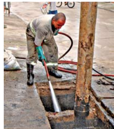
Limpeza na rua Violeta dos Alpes

Para evitar enchentes na cidade, a Prefeitura trabalha constantemente na limpeza de bueiros. Na região de Perus, a Subprefeitura realiza este serviço de forma mecânica e manual. Em 2009, foram feitas 36.442 limpezas nas ruas da região. Você pode acompanhar a programação deste trabalho pela internet. É só acessar o site da Prefeitura ( www.prefeitura.sp.gov.br ) e clicar no quadro “Zelando pela cidade – limpeza de bueiros”, à direita da página. Lá, você indica qual Subprefeitura quer consultar e verá uma tabela com todas as ordens de serviço emitidas, com data, endereço e quantidade de bueiros que serão limpos. Se o prazo anunciado pelas empresas responsáveis não for cumprido, pode entrar em contato com a Ouvidoria do Município pelo telefone 0800-17-5717. Para pedir a limpeza de alguma boca-de-lobo, é só ligar para o 156 ou ir até a Praça de Atendimento da Subprefeitura.