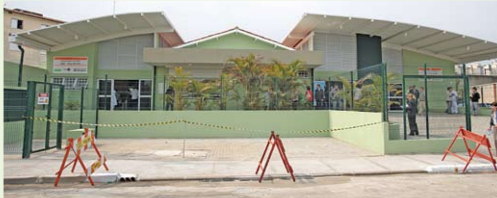
UBS e AMA Vila Sílvia: mais de 9 mil atendimentos médicos por mês

A Vila Sílvia, distrito de Cangaíba, ganhou uma Unidade Básica de Saúde (UBS) e uma Assistência Médica Ambulatorial (AMA). As duas funcionam na rua Belém dos Santos, 222, e juntas têm capacidade para realizar cerca de 9 mil atendimentos por mês. A UBS/AMA Vila Sílvia tem psiquiatra, psicólogo, clínico geral, pediatra e ginecologista. O serviço dispõe ainda de seis dentistas e exames de diagnóstico por imagem, como ultrassonografia e raios-x.