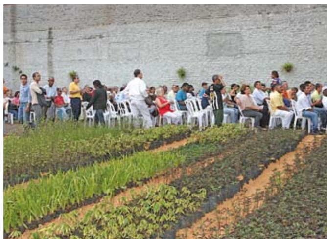
Zeladores de praça: oportunidade de emprego para 371 pessoas

O terreno que pertencia às indústrias Gazarra, na avenida Jacu-Pêssego, foi desapropriado pela Prefeitura. A área de 175 mil m 2 agora é considerada de utilidade pública e já tem destino certo: lá será construído o novo campus da Universidade Federal de São Paulo (Unifesp), seu primeiro na zona Leste. A futura Unifesp Leste integra um conjunto de intervenções e investimentos para a região, dos quais se destaca o Polo Institucional da Zona Leste, que deve contar com vários equipamentos públicos: fórum judiciário, rodoviária, unidades da Fatec, ETEC e Senai, entre outros.