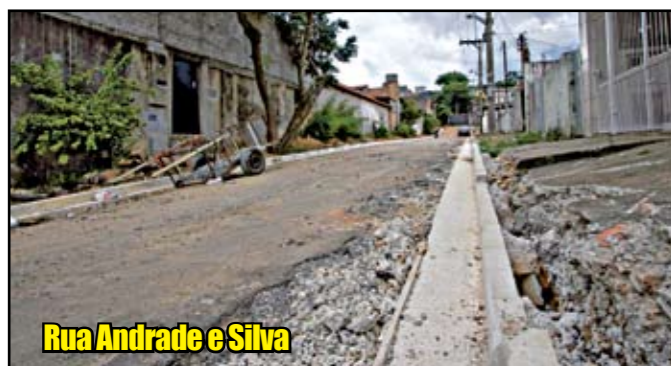
Rua Andrade e Silva