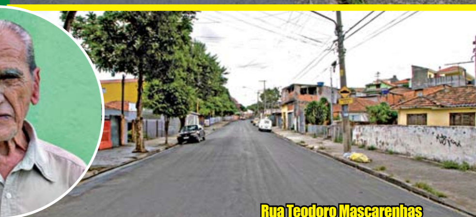
Rua Teodoro Mascarenhas