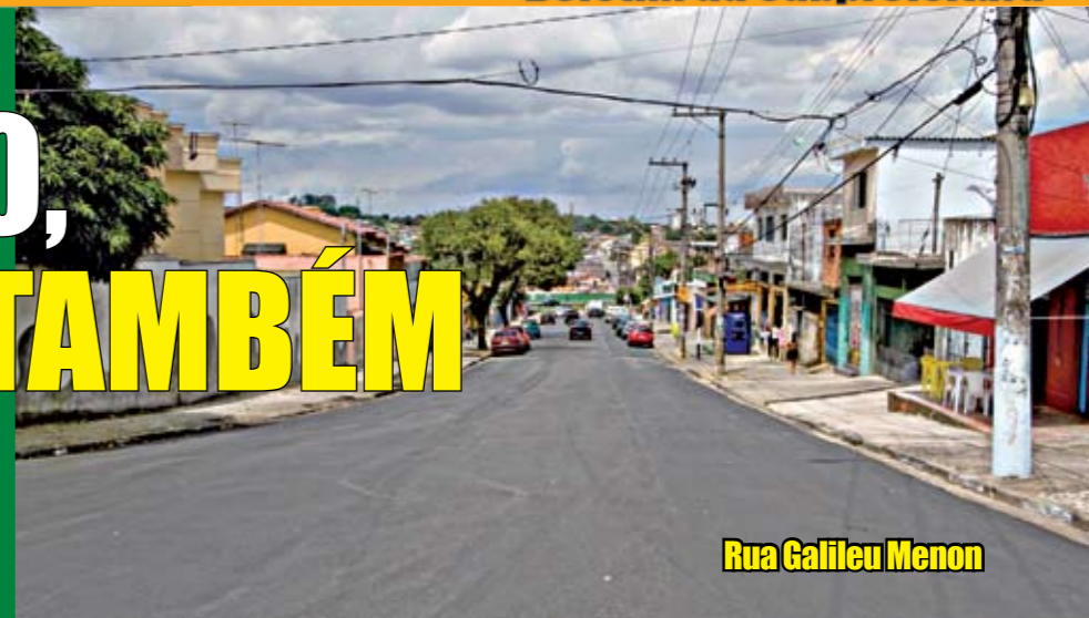
Rua Galileu Menon