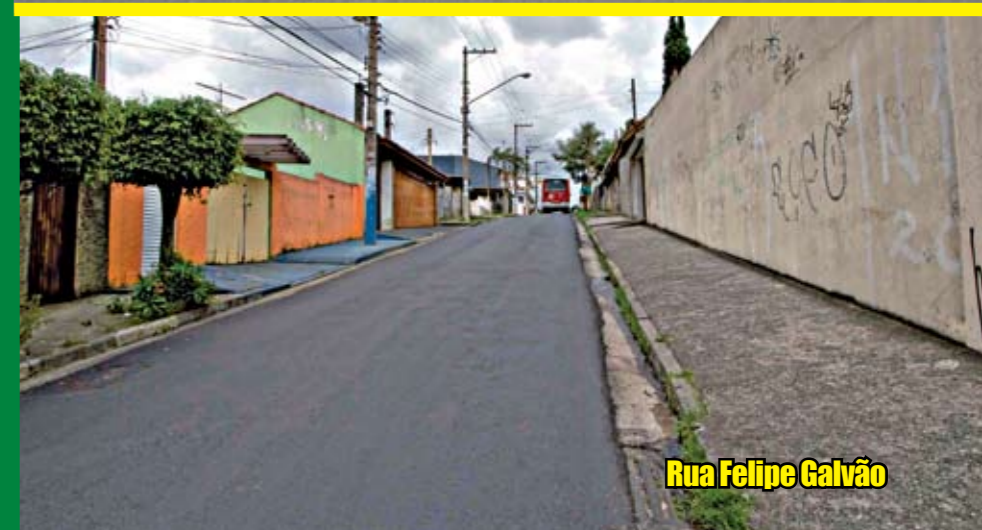
Rua Felipe Galvão