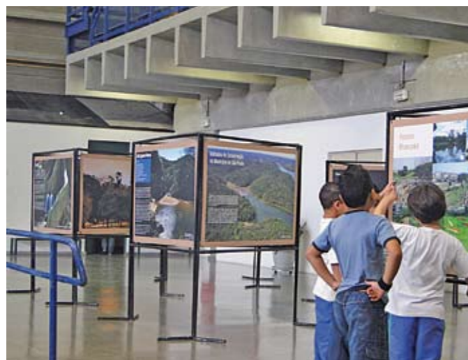
A exposição no CEU Parelheiros: para despertar consciências