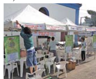
Grupo teatral: pelo ambiente

Preocupação com o ambiente foi o tema do grupo teatral Parlandas, que se apresentou aqui em setembro. O grupo mostra, de forma clara e divertida, as preocupações que devemos ter com o meio ambiente. E ainda há oficinas com sucata, possibilitando o aprendizado da reciclagem. O espetáculo Chua, chua... Isso é hora de brincar? foi apresentado em três finais de semana de setembro. Ainda há tempo de ver: a última apresentação está agendada para 16 de outubro, em Vargem Grande, na rua Beija-Flor.