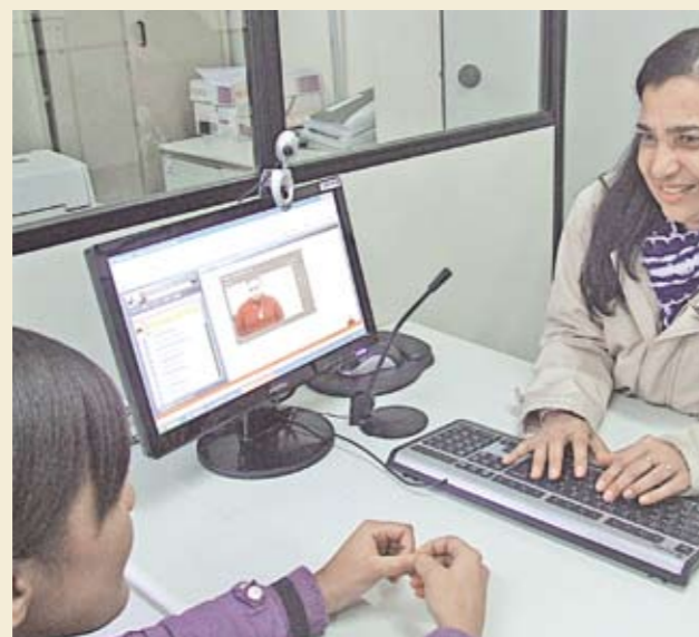
Linguagem dos sinais: atendimento todos os dias

Agora, os funcionários da Praça de Atendimento da Subprefeitura podem receber, atender e esclarecer dúvidas de cidadãos com deficiência auditiva. Eles se servem do sistema que utiliza a Linguagem Brasileira de Sinais – Libras. Um profissional da Secretaria da Pessoa com Mobilidade Reduzida pode se comunicar com quem tem problema de audição por meio de uma câmera ligada ao computador. Esse profissional serve de “tradutor” para o funcionário da Subprefeitura. O atendimento especial está aberto de segunda a sexta, de 8h às 17h.