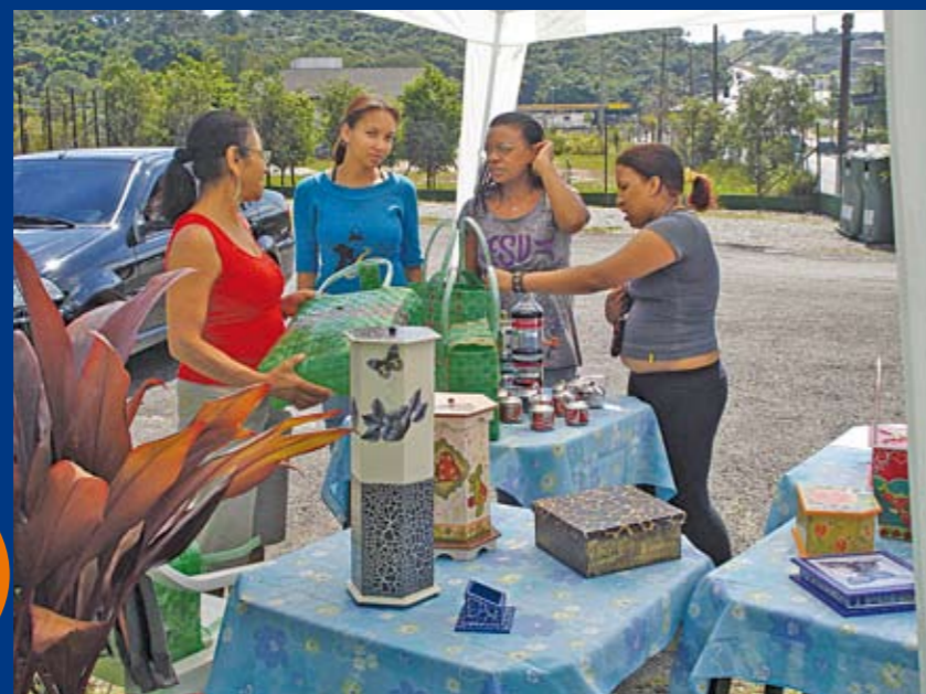
Exposição no PAT: peças bonitas e bem executadas, toda semana

M arque na agenda: toda quarta, quinta e sexta-feira, das 9h às 17h, está aberta para visitação a feirinha de artesanato do Posto de Atendimento ao Turista (PAT), que fica na entrada de Parelheiros. A partir do sábado anterior ao Dia das Mães (8 e 9 de maio) também haverá feirinha nos finais de semana (uma semana sim, outra não), no mesmo horário. As peças são muito bonitas e bem executadas. Se quiser saber mais, ligue diretamente para o PAT: 5925-2736.