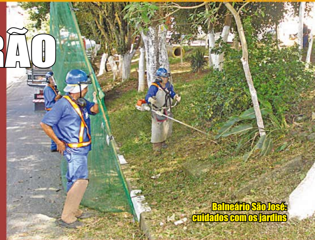
Balneário São José: cuidados com os jardins

P ara quem está acostumado ao Cata-Bagulho que acontece todo último final de semana do mês, foi uma surpresa. Em março, houve também um mutirão – para deixar nossa região mais bonita e limpa. Funcionários da Subprefeitura fizeram limpeza manual de bueiros, limpeza mecanizada de galerias e poda de árvores no Jardim dos Álamos e Jardim Aladim. Já na estrada Engenheiro Marsilac houve uma operação tapa-buracos em toda a extensão. Por fim, na avenida Sadamu Inoue, a principal de Parelheiros, a grama foi aparada. A operação Cata-Bagulho leva essa limpeza para dentro da casa das pessoas: é possível se desfazer de móveis velhos e objetos sem serventia. É só colocar na calçada, no dia definido, o que não serve mais. Para saber o dia que o caminhão passa em sua rua, veja o site da Subprefeitura: http://parelheiros.prefeitura.sp.gov.br . Se a sua rua não estava relacionada na última ação, ligue para 156 e peça a inclusão no programa.