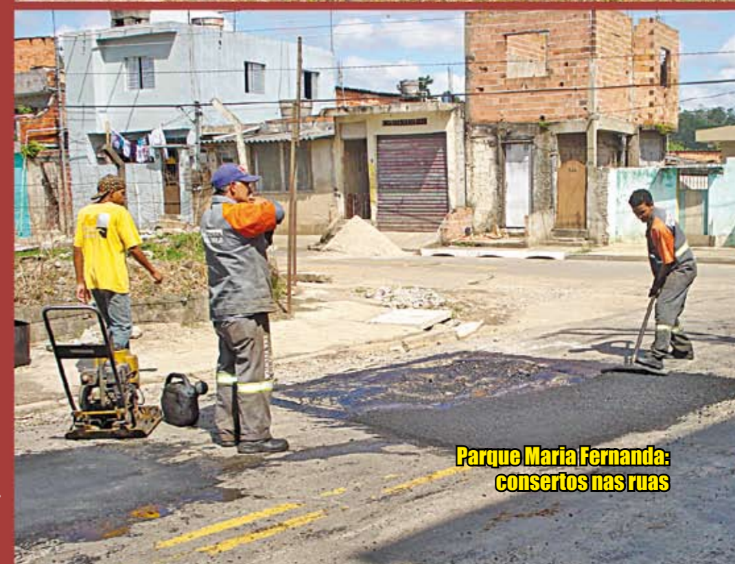
Parque Maria Fernanda: consertos nas ruas