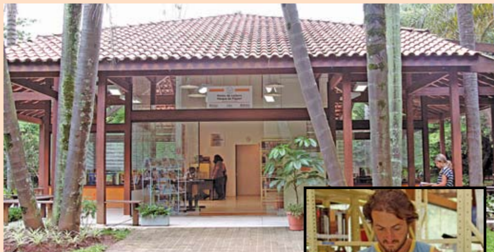
Ponto de leitura: minibiblioteca com 2.000 livros

C omeçou como uma atividade de fim de semana. Mas o projeto Bosque da Leitura, realizado pelas secretarias da Cultura e do Verde e Meio Ambiente fez tanto sucesso que os frequentadores do Parque do Piqueri, no Tatuapé, pediram que o espaço funcionasse também durante os outros dias da semana. Então, a Prefeitura transformou o lugar em um Ponto de Leitura, uma espécie de minibiblioteca. Em suas estantes, há 2.000 livros e os principais jornais e revistas. Além de ler no próprio local, os visitantes podem também fazer empréstimos. O Parque do Piqueri fica na rua Tuiuti, 515, tel. 3862-3581. O Ponto de Leitura funciona de segunda a sexta, das 8h30 às 17h30; e aos sábados e domingos, das 9h às 16h.