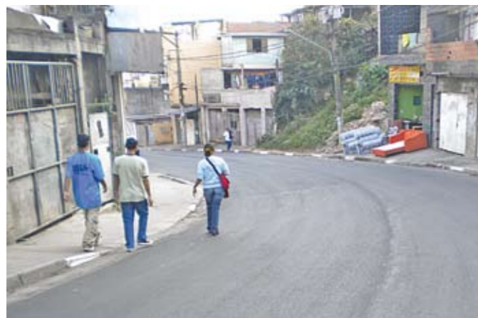
Rua Paolo Pórpora: recapeada em toda a sua extensão

Oito vias foram recapeadas aqui, este ano. Ruas como Francisca Queiroz, José Cassiano Figueiredo e Paolo Pórpora foram revestidas em toda a extensão. A av. Comendador Sant'Anna ganhou asfalto no trecho entre a rua Hisan Mindlin e a estrada do M'Boi Mirim. Também estão como novas as ruas Flandres e Antônio Carlos Nunes. As ruas Abílio César e Agostinho Rubim foram recapeadas em colaboração com a Subprefeitura Campo Limpo.