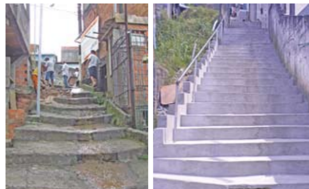
Vial Bento Rodrigues: veja a diferença

Só este ano foram reformadas seis vielas. Talvez o caso em que a população foi mais beneficiada seja a da Bento Rodrigues, que interliga a rua de mesmo nome e a José da Costa Lima, no Jardim Tupi. Os moradores reclamavam que a chuva escorria pelos degraus deteriorados. Foram instalados corrimãos, iluminação e captação de águas pluviais. No momento, outras cinco vielas estão em obras.