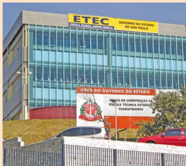
ETEC na região: 350 alunos em cursos técnicos

Desde setembro está funcionando a quinta Escola Técnica Estadual (ETEC) da zona Sul, em Jardim Ângela. A obra foi feita pelo Governo do Estado em terreno da Prefeitura. Abriga 350 alunos cursando Contabilidade, Informática e Segurança do Trabalho. O prédio tem 12 salas, nove laboratórios. Em toda a cidade, funcionam 37 ETECs, que em quatro anos triplicaram o número de vagas no Ensino Técnico, de 5.300 para 16.000.