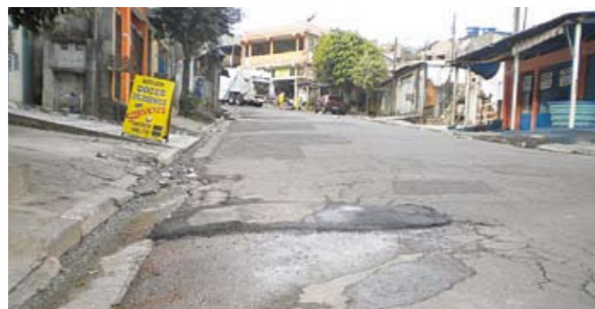
Rua Paolo Pórpura: recapeamento necessário em toda a extensão

Lembra do telhado do Sacolão das Artes, importante polo cultural da nossa região? Estava em mau estado, mas agora já entrou em reforma. Serão substituídas as telhas do mezanino – eram de metal, simples, agora serão duplas, com miolo de poliuretano, para permitir melhor isolamento térmico e acústico. Calhas e rufos furados e enferrujados também serão trocados. Não haverá mais goteiras nem infiltrações. Também será substituída a escada de madeira por uma metálica. Deve ficar pronto até agosto.