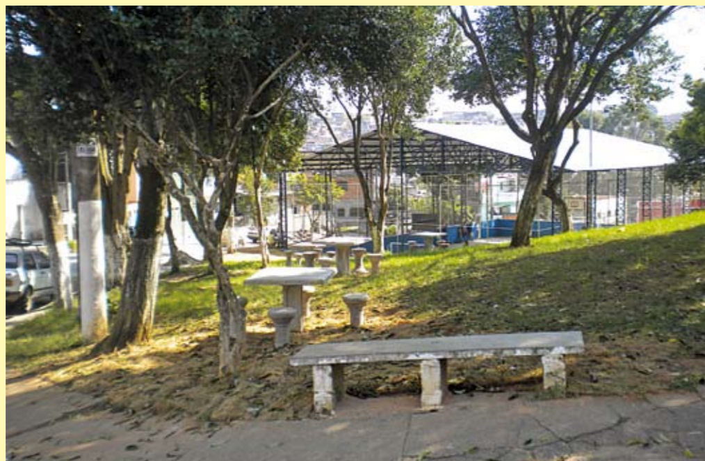
Na praça, novos bancos e mesas - e (ao fundo) a quadra com cobertura e iluminação

D e dia ou de noite, com chuva ou sol, não importa: se você mora no Jardim Ângela, quando quiser praticar esportes, fazer exercícios ou simplesmente passar algum tempo gostoso, venha para a praça das Notas Musicais, na rua Ripieno. A reforma foi concluída e a quadra de esportes, por exemplo, está como nova, com cobertura metálica e iluminação, alambrados e portões. A praça também ganhou novo mobiliário de concreto, o passeio foi recuperado e trocado por piso encaixado e agora há rampas para acesso de pessoas com mobilidade reduzida.