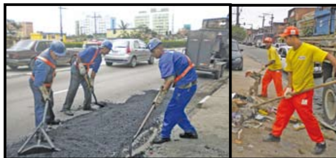
Limpeza na região: buracos tapados e recolhimento de lixo.

Sacolão das Artes para a Companhia Paulista de Teatro, que já atuava no local.