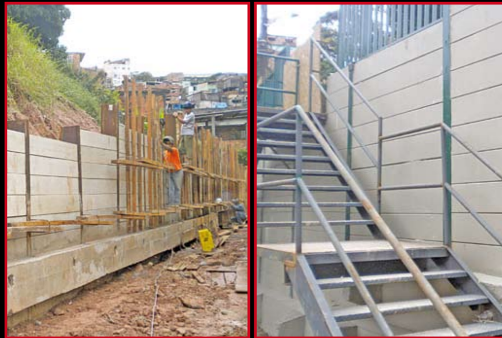
Muros de arrimo contra deslizamentos: na creche e na rua Pandalhos (com escadas)

P ara evitar deslizamentos, mais dois muros de contenção estão quase prontos na região: um fica atrás do CEI Parque Novo Santo Amaro; o outro, na rua Pandalhos. Em um caso como no outro, as obras foram feitas em caráter de emergência. Deslizamentos atingiram o muro da creche e, na Pandalhos, duas casas. Os novos muros têm mais de 3 metros de altura. Foram executados, também, canaletas para captação de águas, recuperação de guias, sarjetas, passeio e leito da rua. Na rua Pandalhos, foram construídas três escadas para acesso dos moradores.