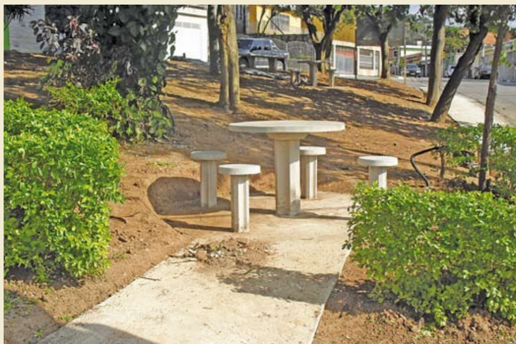
Pracinha entre as ruas Hicavo e Ária: bancos de concreto, passeios e paisagismo

D emorou um pouco, mas valeu a pena esperar pelo novo espaço para convivência na praça entre as ruas Hicavo e Ária, no Parque Alves de Lima. O local entrou em reforma no final do ano passado: o piso antigo foi substituído e a praça ganhou uma nova pista de caminhada. Há mesas e bancos de concreto, ideais para jogos de tabuleiro. Note-se, também, o tratamento paisagístico, a jardinagem e os novos postes para iluminação. O importante, agora, é a cooperação dos moradores, para auxiliar na manutenção e preservação. É a sua praça: se vir alguém jogar lixo ali, telefone para a Subprefeitura (3396-8400) ou para o 156.