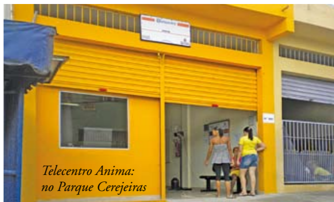
Telecentro Anima: no Parque Cerejeiras