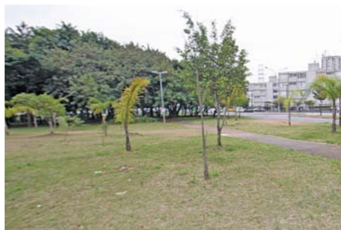
Praça Jácomo Zanella: em breve, novo paisagismo

Que tal aproveitar as férias para participar das oficinas do Espaço Cultural Tendal da Lapa (foto)? São diversas opções para adultos e crianças, como aulas de circo, teatro, música, dança e desenho, entre outras. As inscrições devem ser feitas no local e é preciso apresentar o RG. O Tendal fica na rua Constança, 72, bem ao lado da Subprefeitura. Mais informações pelo telefone 3396-7500.