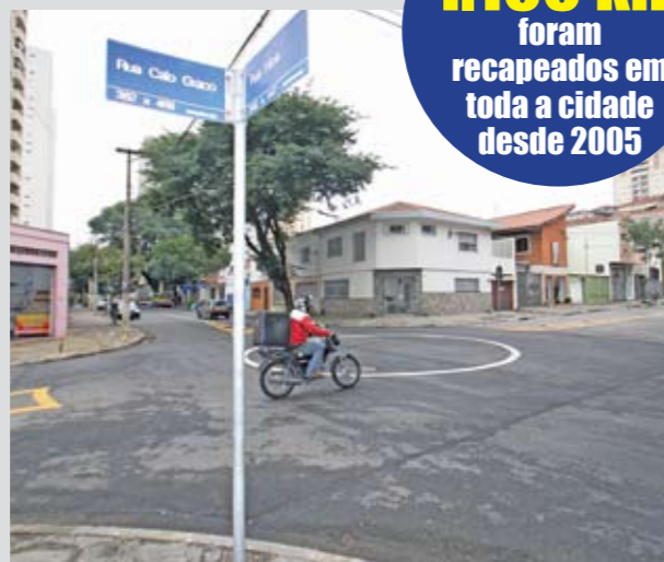
Rua Fábria: fase final da sinalização de solo

As ruas Fábria e Varginha e a avenida Mutinga acabam de ganhar asfalto novo. Elas foram incluídas no maior programa de recapeamento da história de São Paulo. Na Fábria, foi recapeado o trecho entre as ruas Cláudio e Francisco Alves. A Varginha recebeu capa de asfalto em toda a sua extensão. E a avenida Mutinga, desde a via Anhanguera até a rua Oswaldo do Nascimento. Ao todo, foram 2,5 quilômetros de recapeamento só no mês de junho. Desde 2005, trechos de 51 vias foram repavimentados na Lapa, totalizando 61 km.