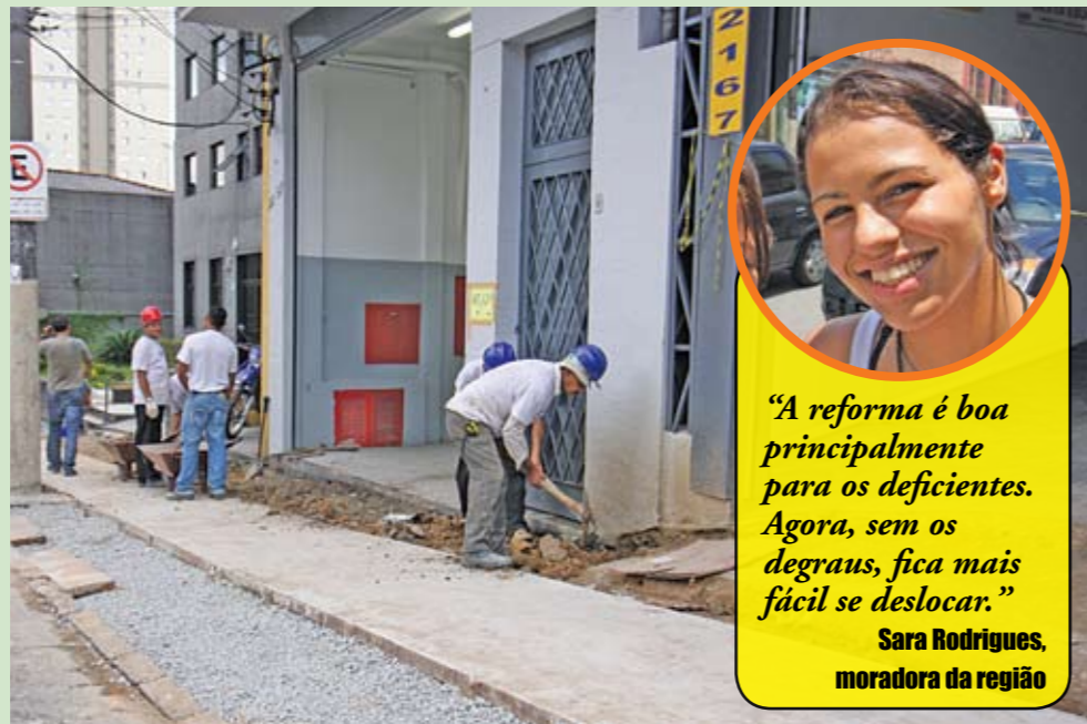
Rua Clélia: reforma começou

C omeçou a última etapa da reforma das calçadas da rua Clélia. São quase cinco quilômetros de passeios, desde a rua 12 de Outubro até a rua Barão de Jundiá. Neste trecho, será usado o concreto moldado, que é antiderrapante e favorece o escoamento da água da chuva, evitando a formação de poças. É um tipo diferente do que foi colocado no restante da rua Clélia, o piso intertravado. Com as calçadas, serão feitas em todas as esquinas rampas para facilitar o acesso de pessoas com necessidades especiais. Claro que as obras provocarão transtornos para pedestres e comerciantes por algumas semanas. Mas vai valer a pena.