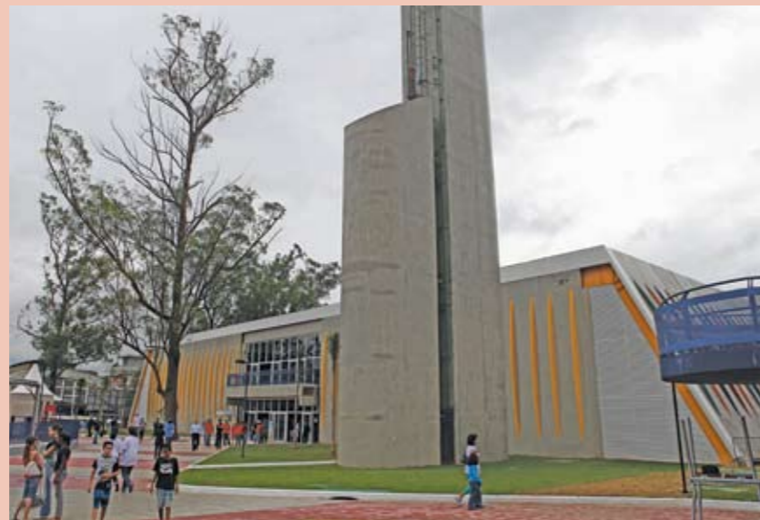
CEU Jaguaré: para alunos e moradores da região

O Centro Educacional Unificado (CEU) Jaguaré já funciona desde o começo de 2009, mas no final de novembro foram entregues as obras que faltavam. Agora, pode receber até 1.500 alunos no Centro de Educação Infantil (CEI), na Escola de Educação Infantil (EMEI) e na Escola Municipal de Ensino Fundamental (EMEF). O CEU tem três piscinas – semi-olímpica, recreativa e infantil –, duas quadras poliesportivas, duas canchas de bocha e um teatro com 184 lugares. Toda essa estrutura melhora bastante não só a educação dos alunos, mas também a qualidade de vida dos moradores da região, que podem desfrutar da estrutura de lazer do CEU, nos finais de semana, incluindo a biblioteca e o Telecentro.