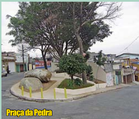
Praça da Pedra