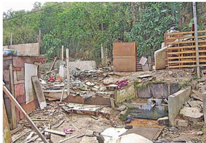
Vila Nilo: moradias irregulares demolidas