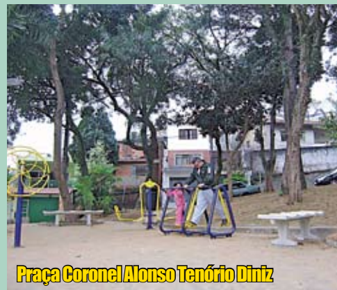
Praça Coronel Alonso Tenório Diniz