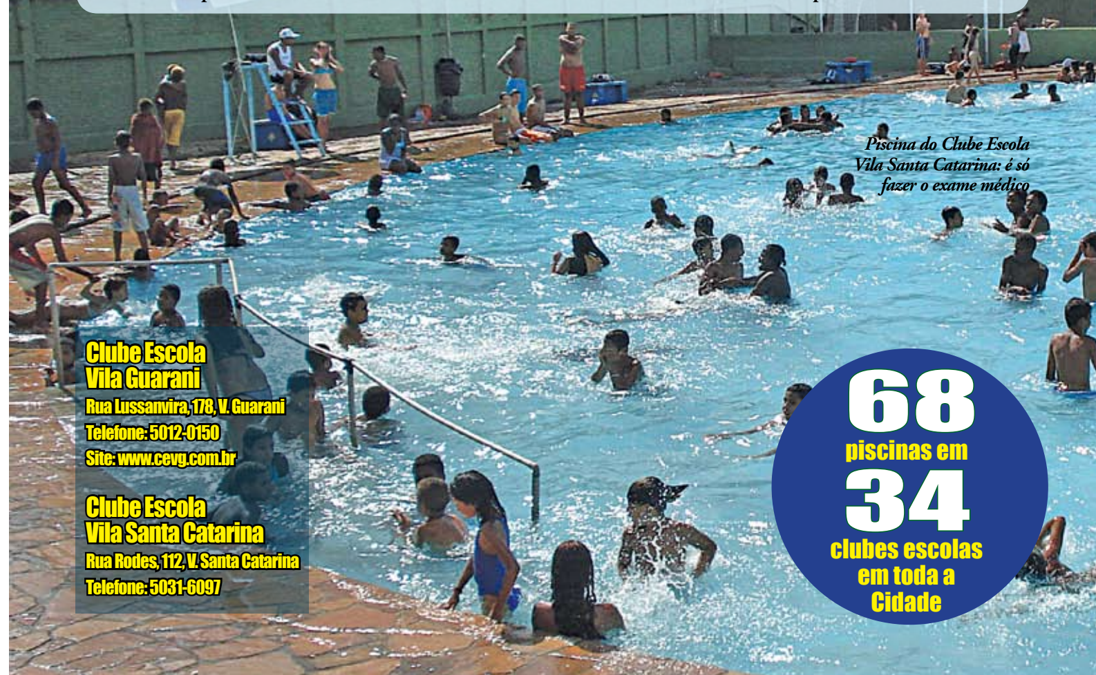
Piscina do Clube Escola Vila Santa Catarina: é só fazer o exame médico

semana, as piscinas são usadas exclusivamente para as aulas de natação, hidroginástica e pólo aquático; nos finais de semana, o uso é livre para recreação, as piscinas ficam abertas a toda comunidade. Para frequentar as piscinas dos clubes da Prefeitura basta fazer a inscrição e o exame médico, no próprio clube. É necessário levar uma foto 3x4, cópia de documento de identidade ou Certidão de Nascimento e comprovante de residência.