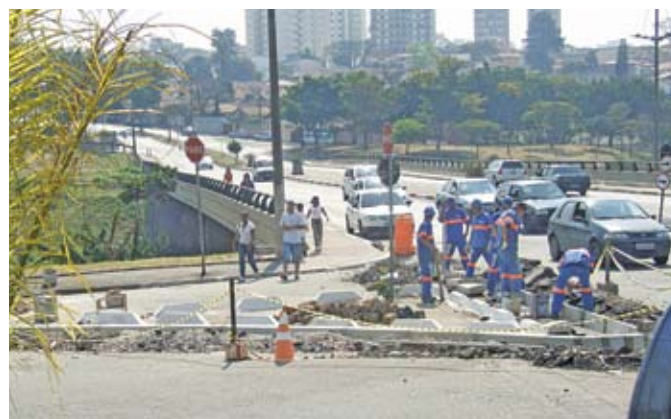
Viaduto Matheus Torloni: o canteiro novo acaba levando à rotatória

Um trecho de 700 m 2 da rua Príncipe das Astúrias está com asfalto novo, colocado sobre os antigos paralelepípedos. O local exato é entre a rua Guian e a Luiza Álvares, na Vila Campestre. O capeamento foi feito a pedido dos moradores: antes, em dias de chuva, o trecho — muito íngreme — chegava a ser perigoso.