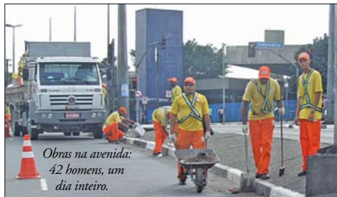
Obras na avenida: 42 homens, um dia inteiro.