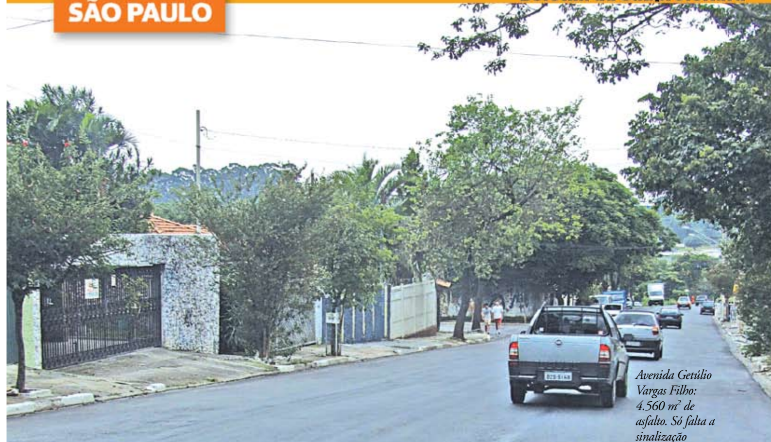
Avenida Getúlio Vargas Filho: 4.560 m 2 de asfalto. Só falta a sinalização