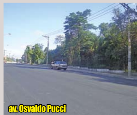
av. Osvaldo Pucci