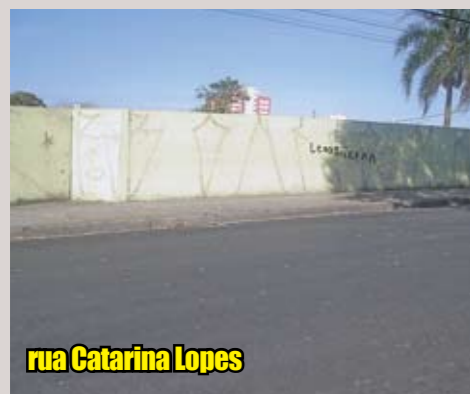
rua Catarina Lopes