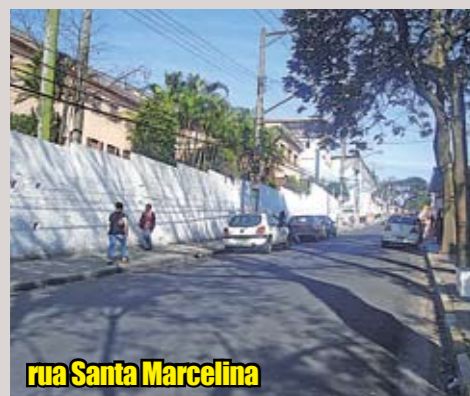
rua Santa Marcelina

Itaquera. Ao todo, foram 5.722 metros de asfalto novo na região, que facilitam a vida de motoristas e pedestres. Esta já é a sétima fase do programa e está beneficiando 40 vias de São Paulo. Só este ano, a Prefeitura já recapeou 415 vias, em uma extensão de 342,5 quilômetros.