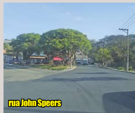
rua John Speers