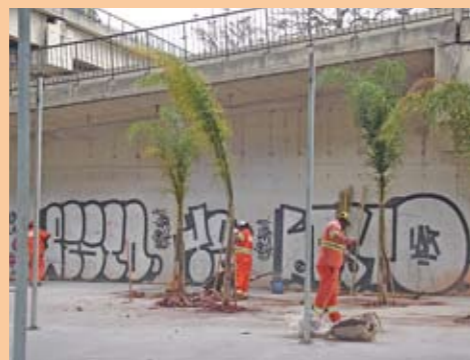
Reforma sob o viaduto: sanitários reformados, piso novo, iluminação, árvores e sem entulho