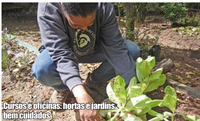
Cursos e oficinas: hortas e jardins bem cuidados

Na esquina da av. Nagib Farah Maluf com a rua Batista Bocelli, em José Bonifácio, está nascendo o sétimo centro de convivência de Itaquera. O espaço vai oferecer diversas atividades culturais, educacionais e profissionalizantes. Também será instalado um telecentro.