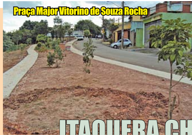
Praça Major Vitorino de Souza Rocha