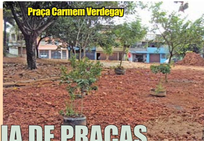
Praça Carmem Verdegay