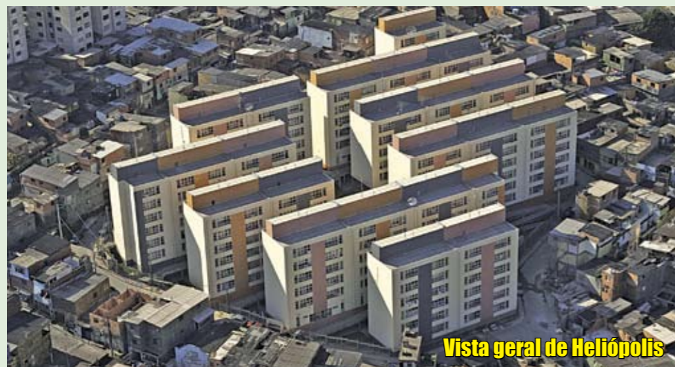
Vista geral de Heliópolis

F oram entregues mais 163 apartamentos em Heliópolis. Construídos com investimento do Programa de Urbanização de Favelas da Prefeitura, por meio de parceria com o Governo do Estado, eles têm dois