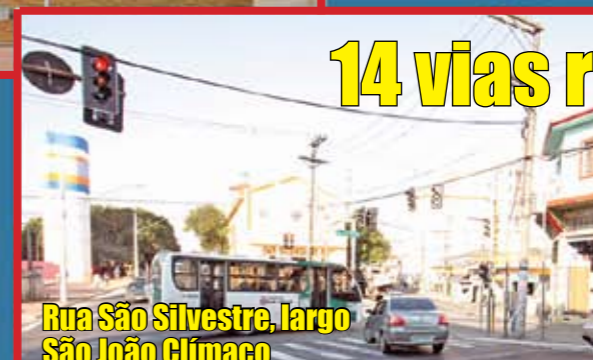
Rua São Silvestre, largo São João Clímaco

Este ano, os distritos do Cursino, Ipiranga e Sacomã tiveram 14 vias recapeadas. Foram 10,6 quilômetros de asfalto novo. Desde 2005, nossa região teve 47,6 quilômetros recapeados em 72 ruas e avenidas.