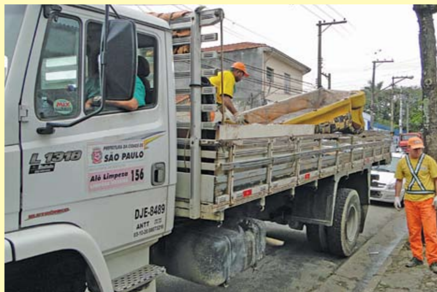
Caminhão da Operação Cata-Bagulho: 434 toneladas recolhidas desde o começo do ano

A o longo de todo o ano, a Subprefeitura Ipiranga vem realizando o trabalho de manutenção para evitar enchentes. A limpeza nos córregos está entre essas atividades. Os 21 córregos da região somam 50 km de extensão. Neles, frequentemente, é feita a limpeza manual das margens e do leito para remover lixo, detritos e restos de entulho que são despejados irregularmente no local ou arrastados das ruas em dias de chuva. Outro trabalho que não para nunca é a operação Cata-Bagulho, que recolhe materiais sem uso, evitando que eles sejam deixados em qualquer lugar e provoquem entupimentos nas galerias. Desde o começo do ano foram recolhidas 434 toneladas de objetos.