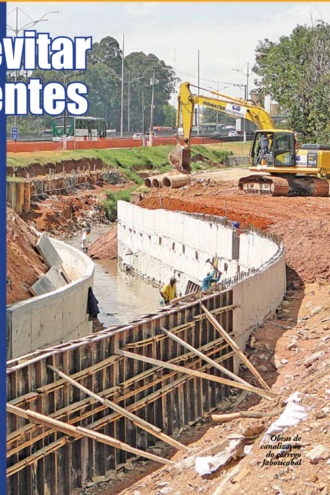
Obras de canalização do córrego Jaboticabal

A obra de canalização e alargamento do córrego Jaboticabal, no distrito do Sacomã, está avançando rapidamente. Assim que estiver concluída, vai diminuir bastante o risco de enchentes naquele trecho, entre as ruas Góis Raposo e Manuel Maños, e nos Jardins Maria Estela, Santa Cruz e Santa Emília. Além da canalização, está sendo feito também um novo muro de arrimo, para substituir o antigo, que desmoronou por causa da chuva, que levou também parte do asfalto da rua Góis Raposo. Veja na última página desta edição outras ações que a Subprefeitura tem feito contra as enchentes. E nas páginas centrais, o trabalho de limpeza de bueiros em toda a cidade.