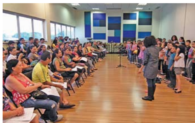
Coral da Gente: alunos se apresentam para os pais