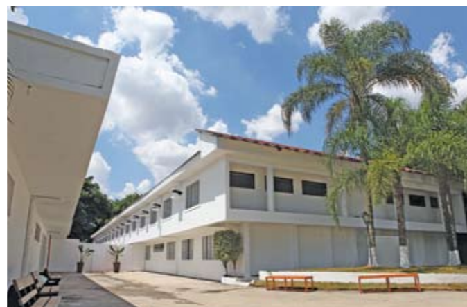
SAID: em breve, capacidade para internar 80 pacientes

M ais nova unidade de saúde inaugurada em Heliópolis, o Serviço de Atenção Integral ao Dependente (SAID) veio se juntar aos outros equipamentos e programas de saúde da região do Ipiranga, todos em operação nos últimos cinco anos. Com o SAID a cidade vai ter, pela primeira vez, atendimento a dependentes químicos em momentos de crise. Por enquanto, são 20 leitos, mas assim que tudo estiver pronto, serão 80. O local terá quadra poliesportiva, espaços de convivência e lazer, refeitório e ambulatório. O SAID fica na avenida Almirante Delamare, 3.033.