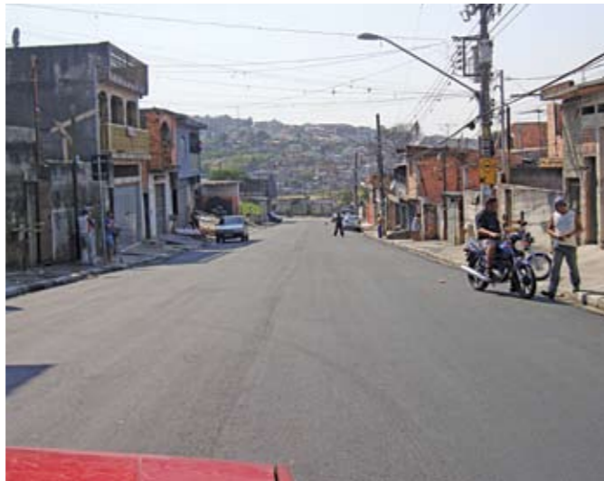
Rua Cristóvão Mendes: recapeamento pronto