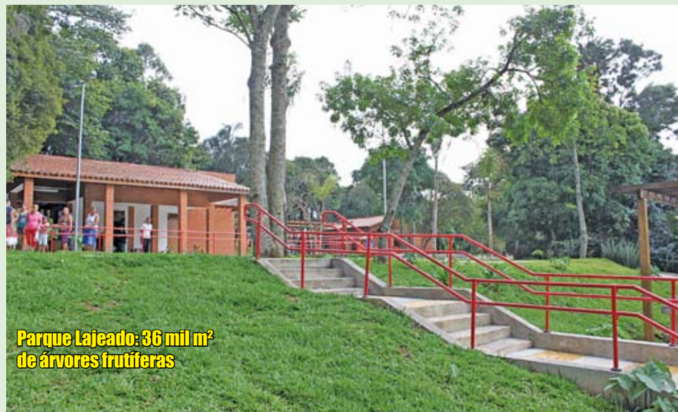
Parque Lajeado: 36 mil m 2 de árvores frutíferas

P rogramão para os fins de semana ensolarados: conhecer o mais novo parque de nossa região. Com 36 mil m 2 , o Parque Lajeado fica na rua Antônio Thadeo, no Lajeado. Como foi instalado em um terreno onde antigamente havia uma chácara, está recheado de árvores frutíferas – são jabuticabeiras, jaqueiras, bananeiras, amoreiras, abacateiros e mangueiras, entre outras. Na área livre foram instalados bancos, mesas e pergolados, que é como são chamadas aquelas estruturas de madeira usadas para trepadeiras subirem. A infraestrutura não foi descuidada: tem banheiros e rampas de acesso com corrimãos. O pessoal da terceira idade, comandado pelo seu José Maria Soares, já está aproveitando: todos os sábados, um grupo de 35 pessoas se reúne lá para fazer ginástica. Agora, só falta batizar o parque com o nome da antiga proprietária da chácara, dona Izaura Pereira de Souza Franzolin, que morreu em 2006, aos 94 anos.