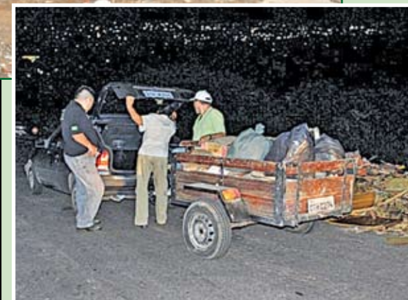
Rua Manuel Álvares Pimentel (foto maior): moradores ajudam na fiscalização; rua Joana de Auvérnia (foto menor): flagrante de despejo de entulho