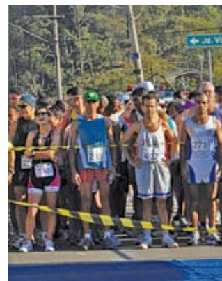
Participantes da edição 2009

Quem costuma utilizar caçambas para depositar restos de material de construção deve ficar atento. Empresas clandestinas cobram pelo serviço e acabam jogando o entulho em lugares não apropriados, causando danos ao meio ambiente. Em 29 de maio, o Departamento de Limpeza Urbana (Limpurb) apreendeu 42 caçambas (18 clandestinas) na região de seis Subprefeituras da zona Norte, incluindo Freguesia/Brasilândia. Foram recolhidas as caçambas não sinalizadas e as que atrapalhavam o trânsito, e multadas as empresas sem cadastro na Limpurb. Para conferir as empresas legalizadas, acesse o site www.limpurb.sp.gov.br ou ligue para 156.