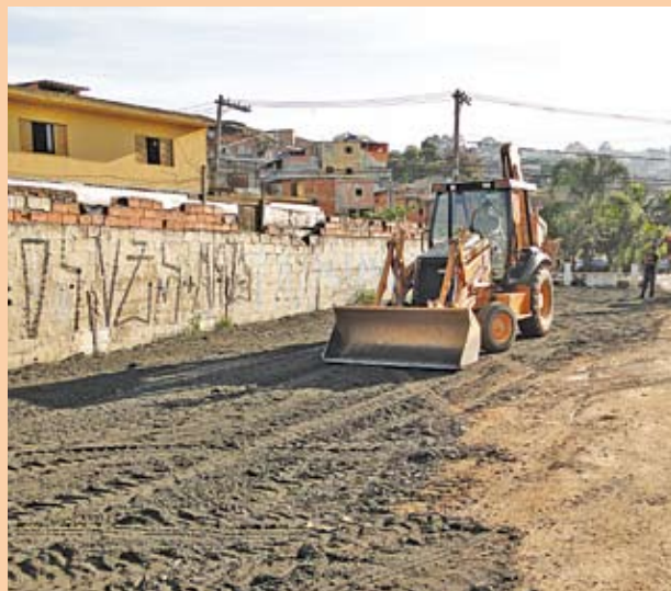
Máquina trabalha após a reconstrução das galerias

Está quase pronta a obra que a Subprefeitura está fazendo na estrada Lázaro Amâncio de Barros, uma importante via da Brasilândia. Na altura do número 340, no cruzamento com a travessa Macajá, sempre que chovia aconteciam alagamentos que atrapalhavam a vida de pedestres, moradores e motoristas que costumam circular pela região. Para melhorar o escoamento da água da chuva ali, foi reconstruída a rede de drenagem, que estava arriada, colocada outra linha de tubos para suporte em cerca de 60 metros e refeitas as tampas das caixas.