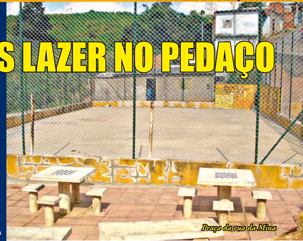
Praça da rua da Mina

Quem mora na Brasilândia vai poder contar agora com mais cinco áreas de lazer na região. Três praças estão sendo reformadas e outras duas estão nascendo por aqui. A Praça Divino Pai Eterno, no Jardim Paulistano, tem 476 m 2 e está recebendo melhorias nas calçadas, área de estar com móveis novos, parquinho infantil, muretas, grama e arbustos. A praça da rua da Mina está passando pelos mesmos reparos, além de troca de alambração e pintura do piso da quadra. No Jardim Elisa Maria, a praça da rua Rosa Alboni é a terceira a passar por reformas, também com troca de areia do playground e fechamento da praça com muro lateral. As duas praças que estão nascendo agora ficam nas ruas Cristiano de Souza e da União, em lugares que eram pontos de depósito de entulho.