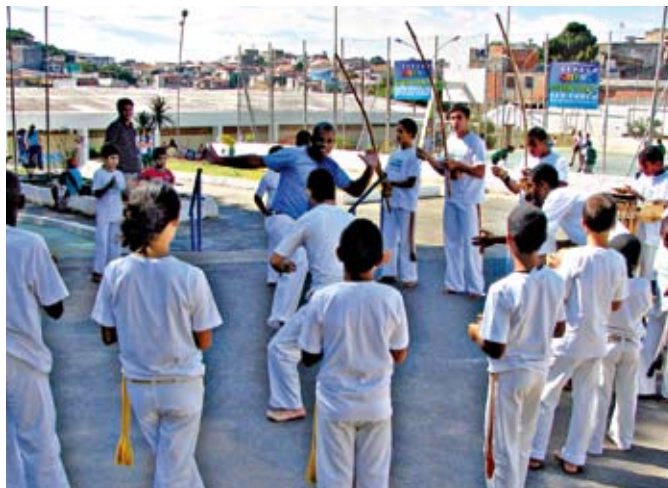
Alunos participam de aula de capoeira no CEE Oswaldo Brandão

Já começou a funcionar a Escola Técnica Estadual Paulistano, no Jardim Paulistano, uma parceria da Prefeitura – que doou o terreno – com o governo do Estado. Os jovens que quiserem fazer um curso técnico nas áreas de Informática ou Administração no segundo semestre já podem ir se preparando. De 30 de abril a 21 de maio, estarão abertas as inscrições para as turmas da tarde e da noite (40 vagas para Informática vespertino; 40 vagas para Informática noturno; e 40 vagas para Administração noturno). O exame será no dia 13 de junho, às 13h30. A Etec Paulistano fica na avenida Elísio Teixeira Leite, 3.611. Mais informações pelo telefone 3471-4071 ou pelo site www.vestibulinhoetec.com.br