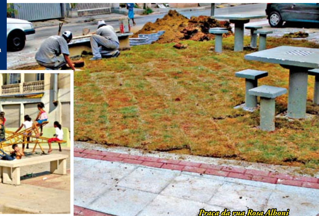
Praça da rua Rosa Alboni