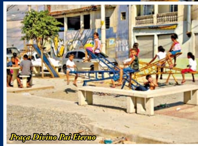
Praça Divino Pai Eterno