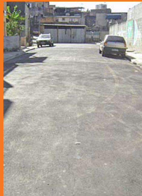
Depois: com o asfalto, a rua virou um tapete