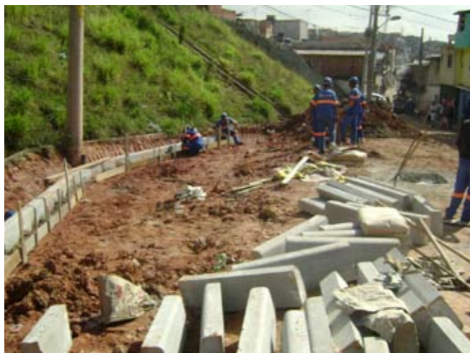
Construção de guias, sarjetas e rede coletora das águas da chuva

A Guarda Civil Metropolitana segue empenhada na Campanha do Desarmamento, que de outubro a dezembro de 2009 tirou 1.100 armas de fogo das ruas. Quem possui uma arma pode entregá-la voluntariamente, sem que a origem do objeto seja investigada. A pessoa ainda recebe uma indenização, que varia de R$ 100 a R$ 300, de acordo com o modelo da arma. O endereço de entrega, em Ermelino Matarazzo, é Estrada de Mogi das Cruzes, 1860, Burgo Paulista. Mais informações nos telefones 2547-4105, 2547-6622 e 2542-0234.