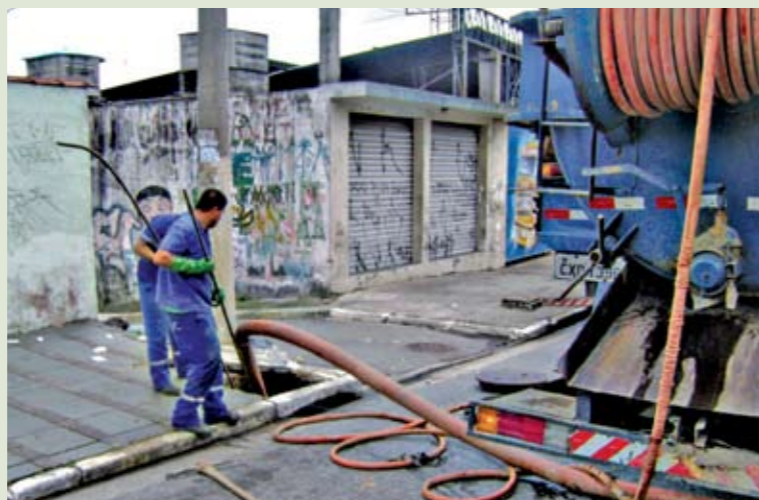
Equipe faz limpeza mecanizada em bueiro da avenida Paranaguá

T ênis, latinha de cerveja, sacola de supermercado e, acredite, até dentadura são alguns dos objetos encontrados nas bocas-de-lobo. Tudo o que é jogado nas ruas escoar para os bueiros quando chove. E, aí, esse lixo entope tudo. O resultado são os alagamentos das ruas e casas. Diariamente, a Subprefeitura realiza o trabalho de limpeza de bueiros. A novidade é que agora você pode acompanhar esse trabalho. E cobrar se ele não for feito. Basta acessar o site da Prefeitura ( www.prefeitura.sp.gov.br ) e clicar em “Zelando pela Cidade – Limpeza de Bueiros”, do lado direito da página. Escolha a sua região e veja a programação diária de limpeza. Se o serviço não for feito, ligue para a Ouvidoria, no telefone 0800-175715, e reclame. A empresa contratada para fazer a limpeza será cobrada.