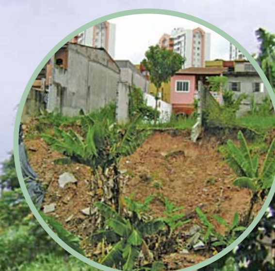
Deslizamento: encosta na rua Dois Irmãos veio abaixo com as chuvas