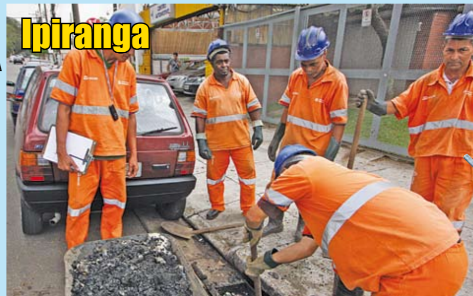
Equipe retira detritos de boca-de-lobo na avenida Nazaré

Calotas de carro, pedaços de madeira, saco plástico, garrafas PET, concreto, animais mortos, restos de tecidos e até celular são alguns dos materiais encontrados nos bueiros