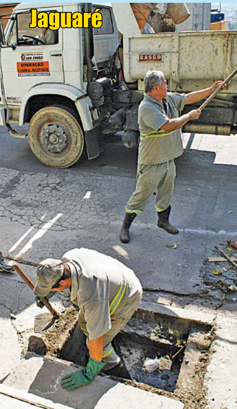
Rua Águas da Prata: sujeira entupiu a boca-de-leão

Em 2010, a Prefeitura está investindo R$ 421 milhões nas obras e serviços de manutenção do sistema de drenagem da cidade