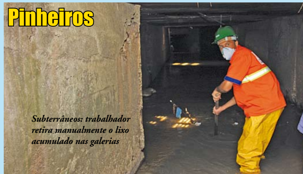
Subterrâneos: trabalhador retira manualmente o lixo acumulado nas galerias

O lixo jogado nas ruas não entope só os bueiros, mas também os piscinões construídos para absorver o excesso de água das chuvas