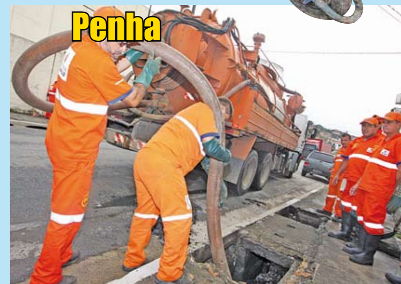
Limpeza mecanizada de galeria na rua Dona Joaquina Santana