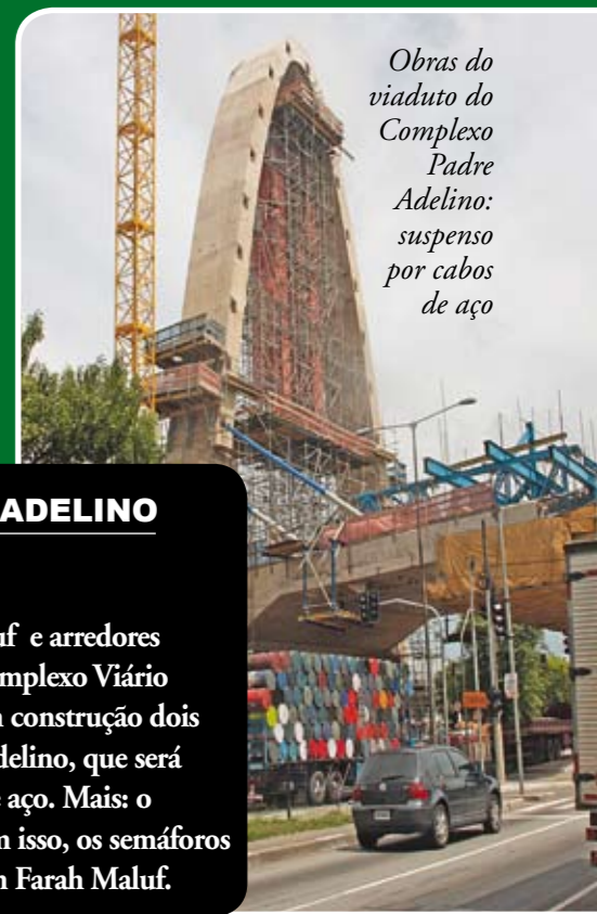
Obras do viaduto do Complexo Padre Adelino: suspenso por cabos de aço

A terceira ponte do Complexo Anhanguera, que liga a rodovia à pista sentido Dutra da Marginal Tietê, vai diminuir os congestionamentos na região. As obras estão adiantadas. O trânsito já melhorou com a entrega, em maio de 2009, das duas primeiras pontes, no sentido Lapa-Pirituba.