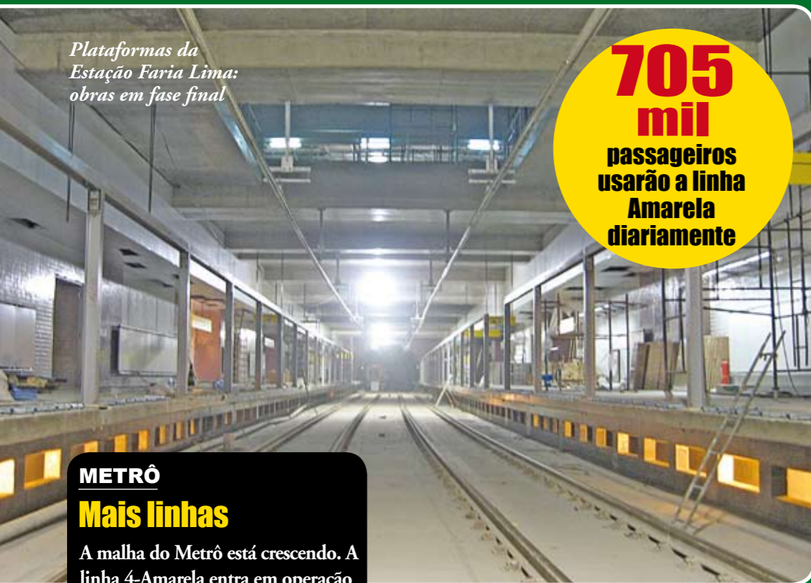
Plataformas da Estação Faria Lima: obras em fase final

Nos próximos meses ficam prontas muitas das obras que a Prefeitura de São Paulo e o Governo do Estado vêm fazendo com o propósito de melhorar o trânsito e o sistema de transporte coletivo. Acompanhe quais são algumas delas e como vão melhorar a vida das pessoas