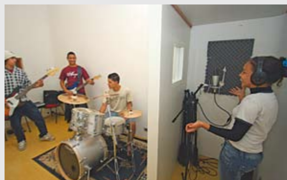
Estúdio da Estação Juventude: horário ampliado