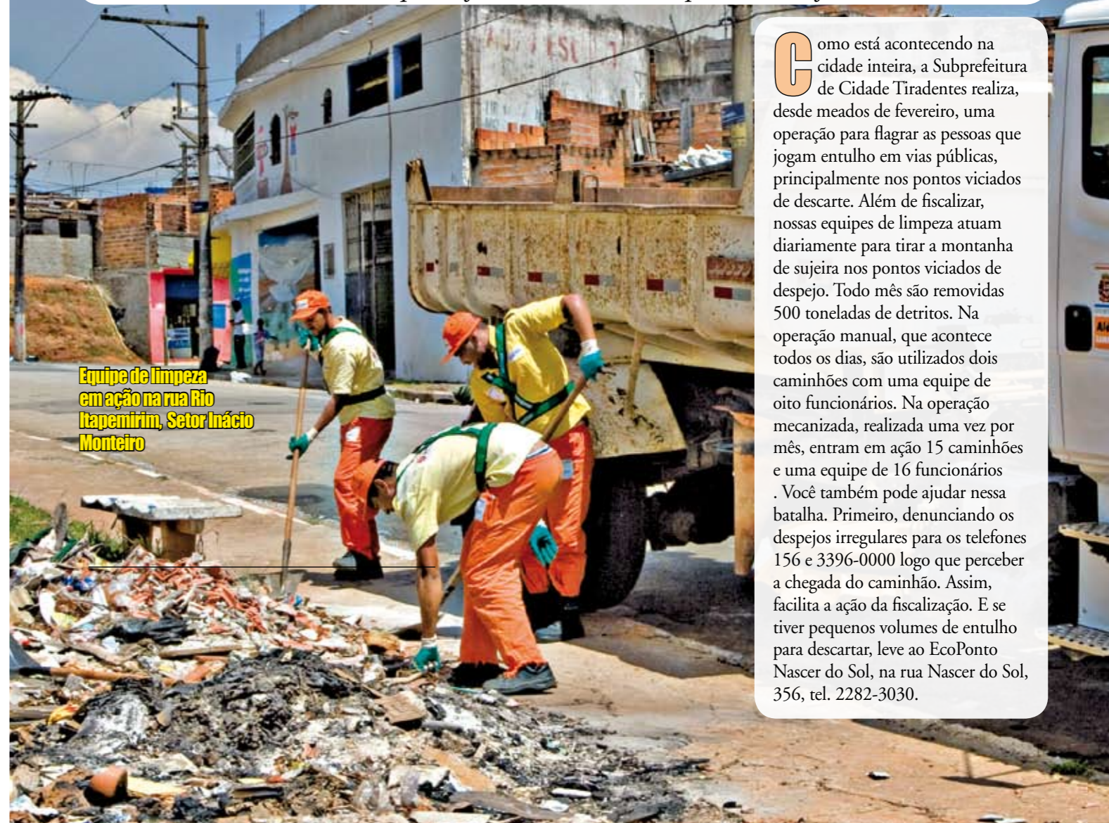
Equipe de limpeza em ação na rua Rio Itapemirim, Setor Inácio Monteiro

O trabalho de limpeza e a fiscalização contra despejos irregulares não param, mas você também pode ajudar a combater esse problema. Veja como