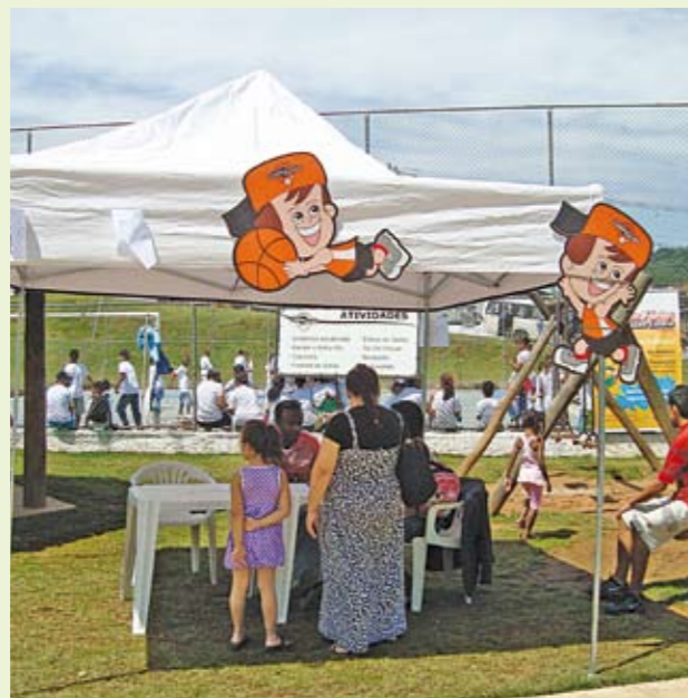
Primeiro Clube Escola Itinerante: 200 participantes

Você ainda não conhece as atividades de nossos dois Clubes Escolas? Pois agora tem uma ótima oportunidade para conhecer. A Secretaria Municipal de Esportes, em parceria com a Supervisão de Esportes da Subprefeitura, lançou em janeiro o projeto Clube Escola Itinerante. A ideia é levar para os 15 setores de Cidade Tiradentes uma mostra das atividades físicas desenvolvidas nos Clubes Escolas JK (av. Inácio Monteiro, 55) e Tiradentes (av. dos Metalúrgicos, 2255). Durante um dia inteiro, sempre nos finais de semana, a população pode participar de oficinas de capoeira, judô, caratê, ioga e tai-chi-chuan, entre outras. E quem se interessar pode se inscrever para participar das atividades regulares. Confira a programação das oficinas itinerantes ao lado e participe.