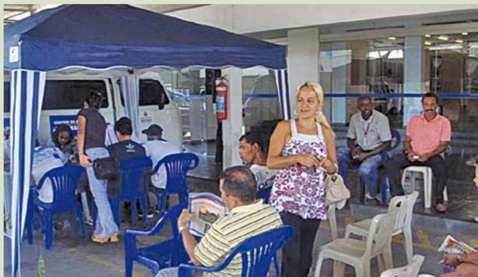
CAT Móvel: encaminhamento para oportunidades de emprego

Entre 27 de setembro e 8 de outubro, a unidade móvel do Centro de Apoio ao Trabalho (CAT) esteve no Jardim Niterói, no distrito de Cidade Ademar. Cerca de 100 pessoas por dia passaram pelo local, na rua Samuel Arnold, em busca de Carteira de Trabalho, habilitação ao seguro desemprego e, principalmente, cadastro para intermediação de emprego. Com os CATs Móveis, a Prefeitura, por meio da Secretaria de Desenvolvimento Econômico e do Trabalho, quer ampliar e facilitar o atendimento, em especial nos bairros mais distantes. Em breve, o CAT móvel vai voltar à região.