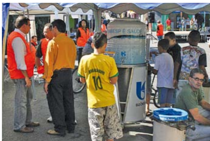
Subprefeitura Presente no J. Niterói: burocracia simplificada.

Para fazer cumprir a Lei Cidade Limpa, a Subprefeitura fez em maio um grande mutirão de fiscalização na Pedreira. Ali, foram recolhidos 23 cartazes e faixas ilegais (foto), em postes e fachadas de comércio. Uma loja na rua Dr. Sílvio de Camargo foi multada e lacrada por falta de alvará e por fazer obra no passeio público. Mutirões de fiscalizações são constantes aqui — para cumprir as leis.