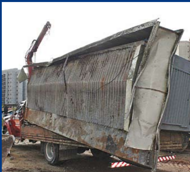
Banca retirada: ali, funcionava um ponto de drogas

Após seguir denúncias de moradores do bairro Pedreira, a Subprefeitura encontrou e removeu uma banca de jornais ilegal e abandonada, na rua Gonçalves Camacho, altura do número 105. O local servia de ponto de venda e uso de drogas e para prostituição. Após vistoria, a Fiscalização e Apreensão da Subprefeitura constatou que a banca não tinha licença para funcionamento e que o dono nada informara à Prefeitura. A banca foi retirada inteira por guinchos e encaminhada ao depósito da Subprefeitura.