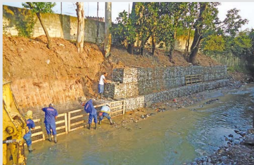
Gabiões (cestos de pedras) nas encostas do córrego Cordeiro: mais segurança contra enchentes

E stão em andamento as obras no complexo do córrego Cordeiro. Agora, é o trecho que abrange um quilômetro em Americanópolis, entre a rua Bruno Taut e a avenida Nossa Senhora do Sabará. Foram construídas margens de contenção e muros de gabião (cestos de pedras), que servem de amarração e sustentação para as encostas. É a maior obra em andamento da Subprefeitura. O córrego começou a sofrer intervenções contra enchentes em agosto de 2009. Até junho deste ano todas as obras devem estar concluídas. Serão beneficiadas pela obra os moradores das ruas Jacinto Paes, Leopoldo Lugones, Calidássia e avenida Cupecê com rua Rubens Fachinni.